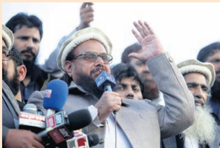
In this Feb. 5, 2019 file photo, Hafiz Saeed, chief of Pakistani religious group Jamaat-ud-Dawa, addresses a rally in Lahore, Pakistan.